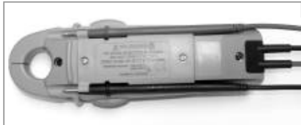
Une découpe très fonctionnelle pour fixer les cordons de test.